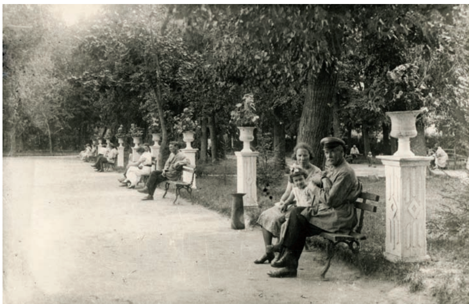
Аллея ваз на бульваре им. Н. Климовой в Рязани. 1939 г.

По данным на 1939 г. численность населения Рязанской области составляла 1 924 900 человек, из них трудоспособного 900 760. В г. Рязани проживали 95 367 человек.