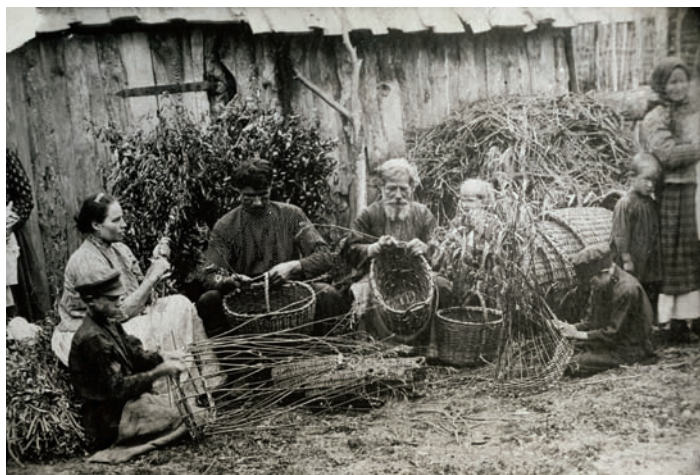
Плетение корзин. Рыкова слобода, Рязанский уезд. Фото 1916 г. из фондов РИАМЗ.

Современное народное искусство как составляющая декоративно-прикладного искусства Рязанского региона тесно связано с накопленным столетиями коллективным творческим опытом. Мастера и художники промыслов продолжают и возрождают древние традиции, развивают их и творчески переосмысливают. Создавая уникальные произведения при-