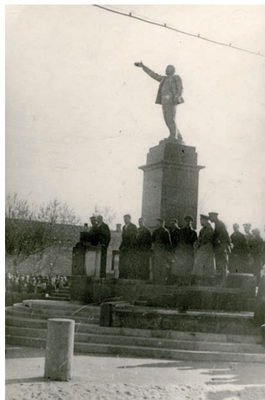
Открытие памятника Ленину в Рязани. Речь на митинге у постаменты памятника. 1937 г.