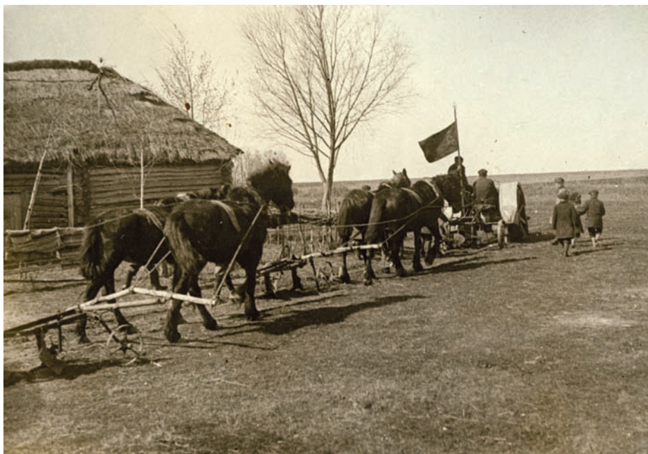
Праздник первой борозды в колхозе «Ленинский путь» Спасского района. 1937 г.

дущей Липецкой области (образована в 1954 г.).