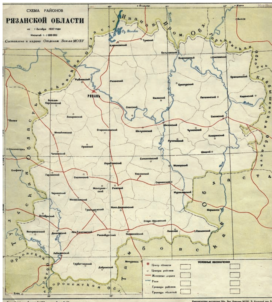
Схема районов Рязанской области на 1 октября 1937 г. (Из фондов РИИМЗ).

На 1 января 1938 г. территория области составляла 50,2 тыс. кв.км. На схеме 1937 г. видно, что она простиралась гораздо южнее нынешних границ: в ее состав входила часть бу-