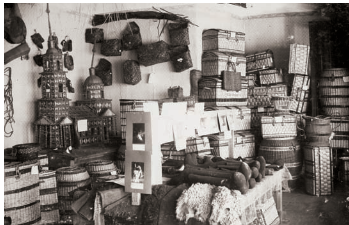
Историческая часть выставки рассказывает о деятельности Кустарного музея Рязанского губернского земства (его фонды впоследствии вошли в собрание РИАМЗ). Фото 1916 г.